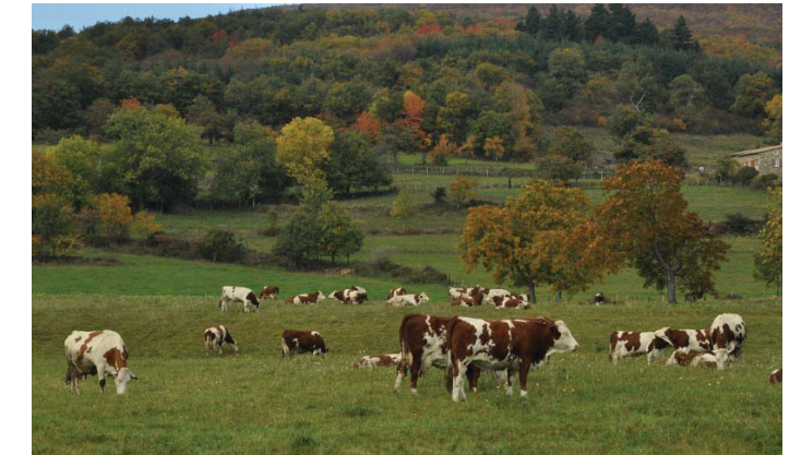
Le Pilat, 7 500 vaches laitières pour produire 37 millions de litres de lait

C'est pourquoi les agriculteurs réalisent des productions de qualité, recherchent une meilleure valorisation de celles-ci par la labellisation et la vente directe : 1/3 des fermes font de la vente directe au moins en partie.