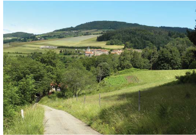
Le Pilat, un territoire de prairies

Ici, les enjeux pour l'avenir sont le maintien global de la qualité environnementale et du cadre de vie en anticipant les évolutions et en accompagnant des mesures propres à cette sauvegarde et au maintien d'une vie économique et sociale dynamique.