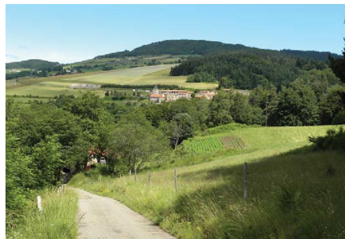
Le Pilat, un territoire de prairies

Ici, les enjeux pour l'avenir sont le maintien global de la qualité environnementale et du cadre de vie en anticipant les évolutions et en accompagnant des mesures propres à cette sauvegarde et au maintien d'une vie économique et sociale dynamique.