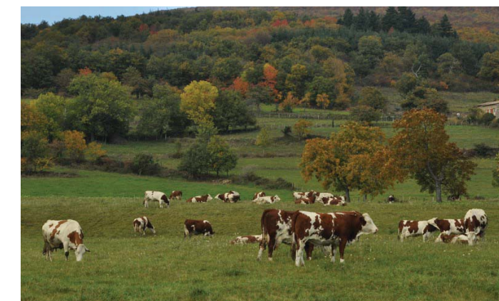
Le Pilat, 7 500 vaches laitières pour produire 37 millions de litres de lait

C'est pourquoi les agriculteurs réalisent des productions de qualité, recherchent une meilleure valorisation de celles-ci par la labellisation et la vente directe : 1/3 des fermes font de la vente directe au moins en partie.