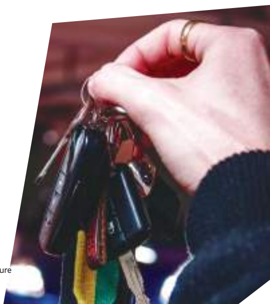
Partager une voiture entre particuliers

passages de pèlerins sur le St-Jacques de Compostelle (estimation à partir du livre d'or de la chapelle du Calvaire à Chavanay)