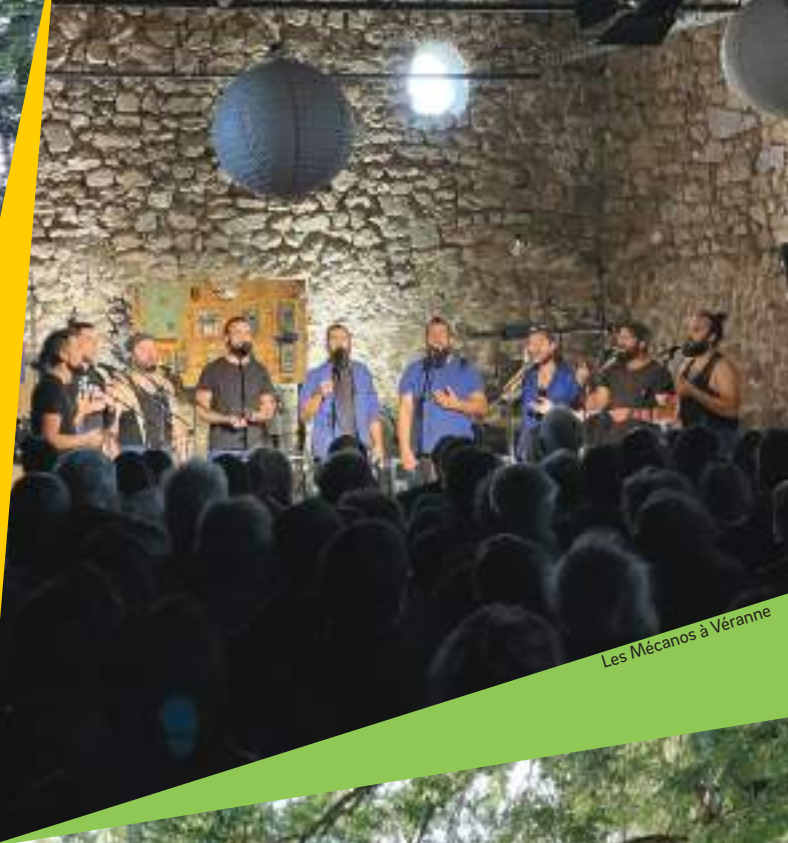
Les Mécanos à Vèranne