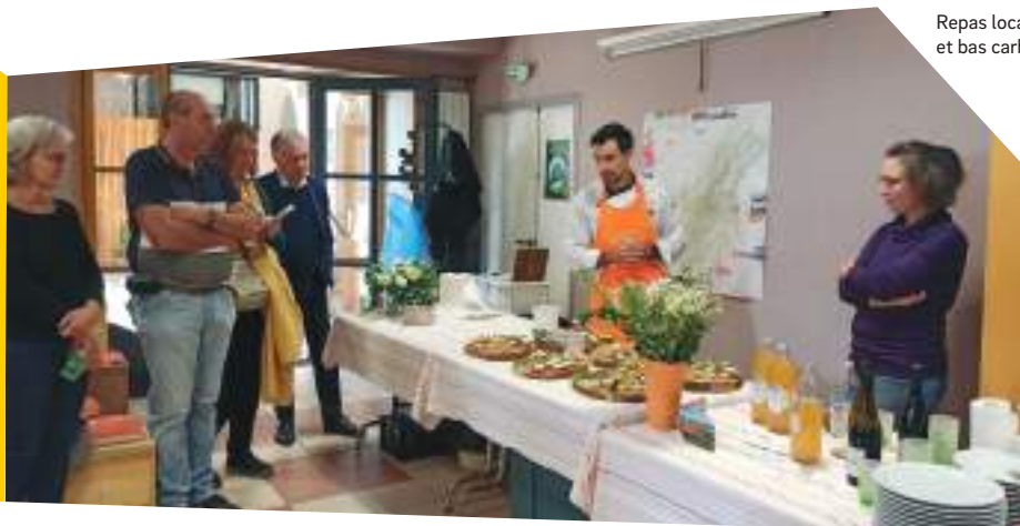
Repas locavore et bas carbone

personnes accueillies sur le Marteloscope de Pélussin, sur 4 séances.