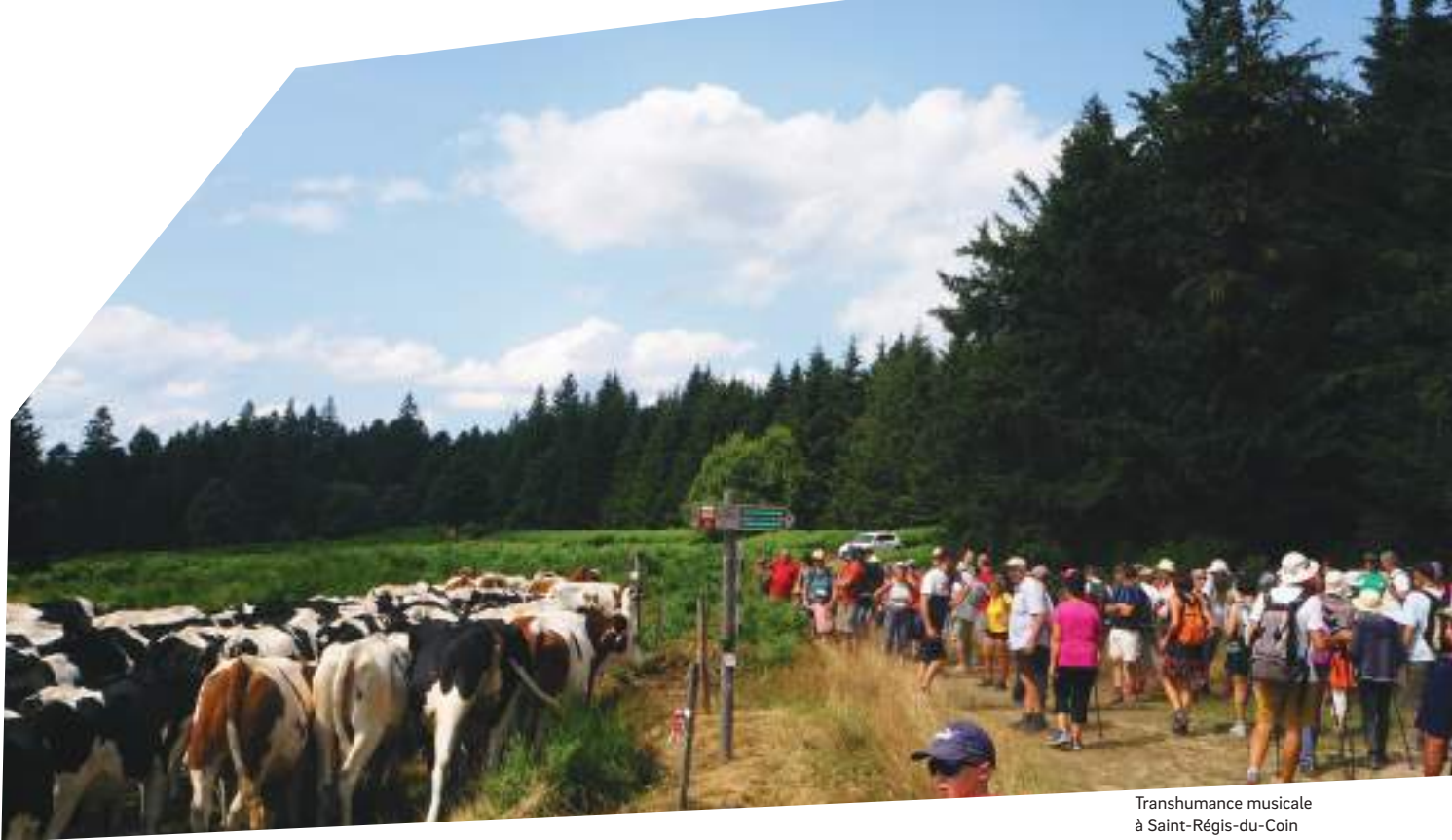
Transhumance musicale à Saint-Régis-du-Coin