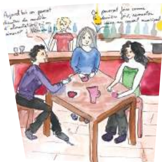
Illustration des étudiants pour le plan d'action Coup de pouce climat de Véranne

Stimuler l'innovation et l'approche prospective par des collaborations ou coopérations.