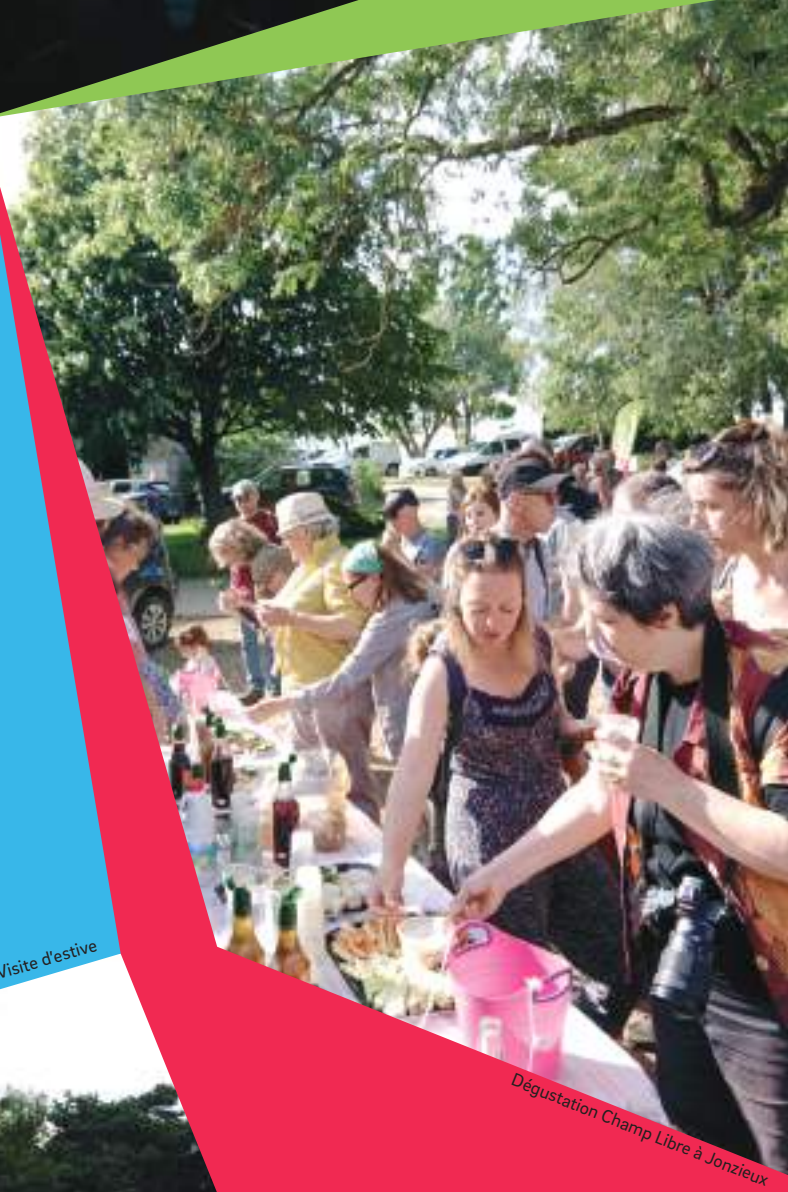
Dégustation Champ Libre à Jonzieux