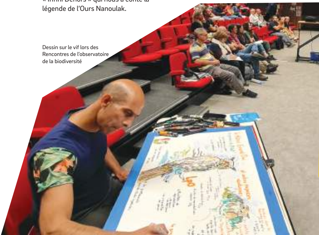
Dessin sur le vif lors des Rencontres de l'observatoire de la biodiversité

La journée s'est terminée par l'intervention poétique de la compagnie « Infini Dehors » qui nous a conté la légende de l'Ours Nanoulak.