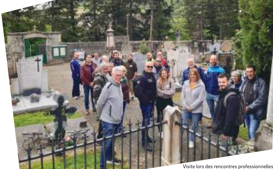
Visite lors des rencontres professionnelles sur la Gestion des espaces verts