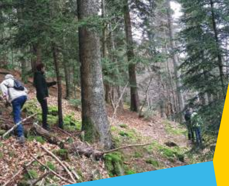
Jury du Sylvotrophée