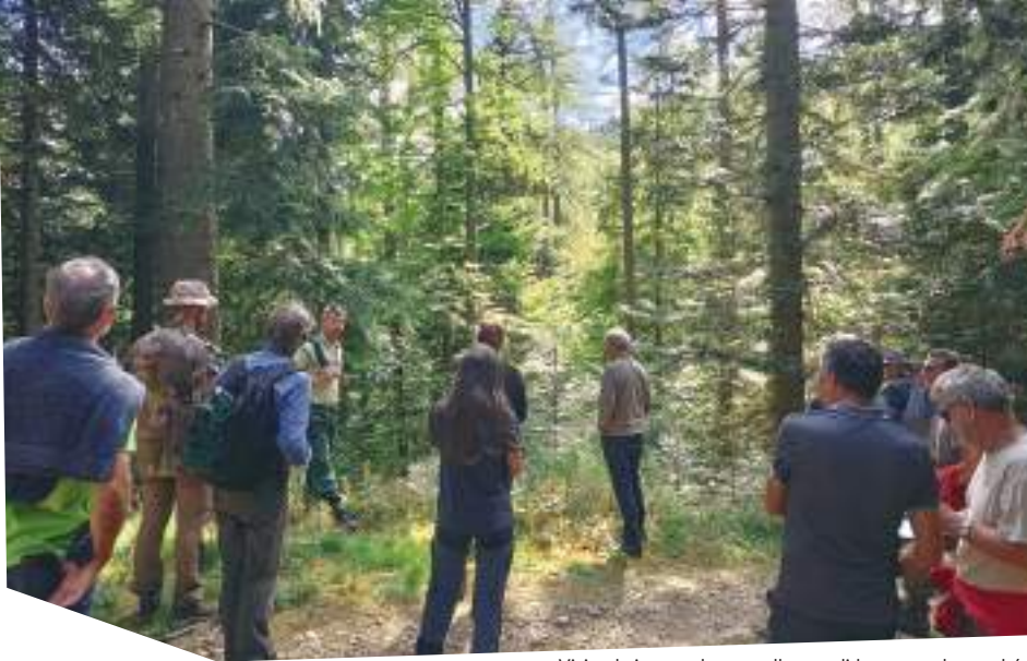
Visite du jury sur les parcelles candidates au sylvotrophée