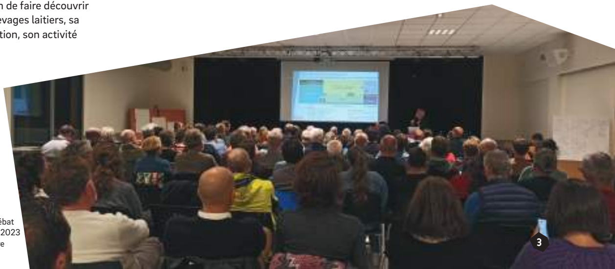
Conférence-débat du 25 octobre 2023 sur l'agriculture

Ce fut aussi une occasion de rencontres professionnelles très enrichissantes pour l'équipe d'entretien de la nature du Pilat.